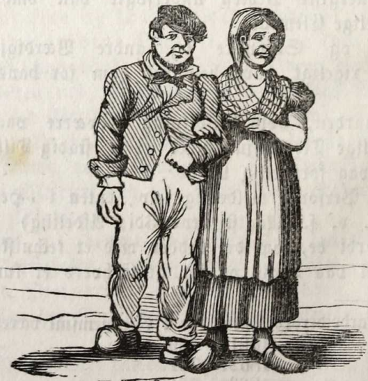
Et Par Kiærestefolk fra Ladegaarden der gaae ud en Søndagmorgen.

Af det Anførte vil man see, at paa Ladegaarden lever Armoden — af oekonomiske Grunde — sammen med Forbrydelsen, et Rakkerskab, der dog ei er saa farligt, som det ved første Blik synes: Forskjellen mellem disse to Slags Beboere er meget hyppigt overmaade ringe. — Livet har efterladt Pletter hos dem begge.