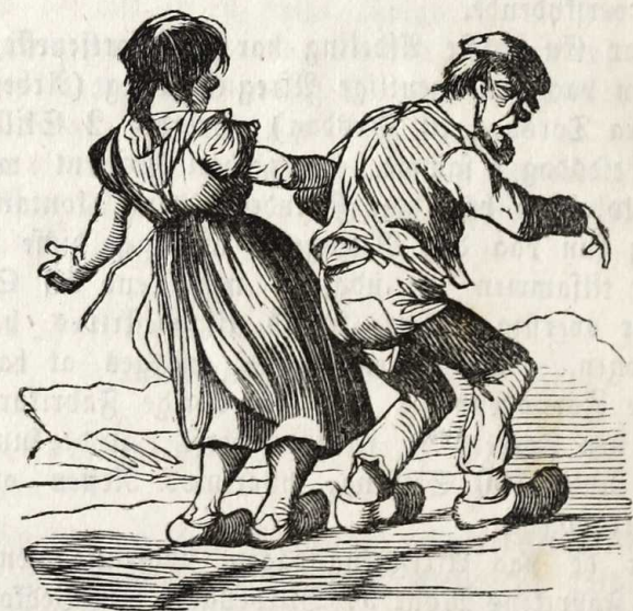
Kjærestefolkenes Hjemkomst Søndag Aften.

Hele Udbyttet af Overarbeide er for Tiden kun ringe, det skal omtrent beløbe sig til 1000 Rd. aarlig.